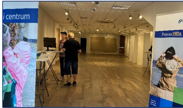
Pop up Kundeservice i Bispegade d. 11. september.

Mange forbrugere ringer ind for at få hjælp til de digitale løsninger, herunder især 'MinForsyning'. Pop up Kundeservice er et nyt initiativ til bedre at kunne hjælpe kunderne, der hvor de er. I tre timer lejede vi os derfor ind i et ledigt butikslokale i Bispegade. Enkelte kunder kiggede forbi. Efter en evaluering har vi besluttet at gentage initiativet med Pop up Kundeservice, men denne gang ude på genbrugspladserne.