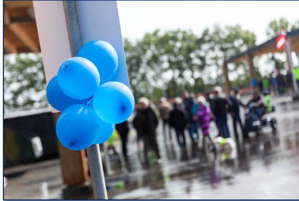
Åbning af Gram Genbrugsplads

Fredag den 23. august kunne vi endelig afholde snoreklip. Pladsen er nu dobbelt så stor, containerne står under niveau i forhold til bilerne, så kunderne undgår dårlige løft og der er blevet adgang med Provas 24/7.