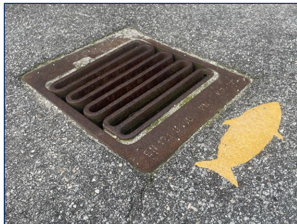
Gul fisk ved en vejrist.

Initiativet er blevet taget godt imod af lokalpressen og følgerne på Facebook, og en kunde har ringet til Kundeservice for at høre mere. Tanken er, at der også kommer fisk ved kloakriste i de andre af vores separatkloakerede områder.