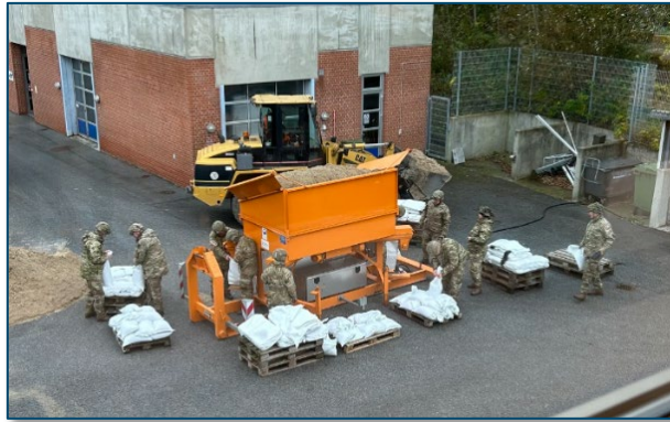
Fyldning af sandsække, oktober 2023

Den planlagte løsning tager udgangspunkt i kote 3,32 på kanten af sparebassinerne. Der etableres en væg af betonelementer fra det sydligste punkt på sparebassinerne og 80 meter sydpå langs Humlegårdsbæk. Græsarealet nord for forsyningshuset hæves med en cirka 50 cm og indkørslen forberedes til aflukning med L-profiler og enkelte sandsække.