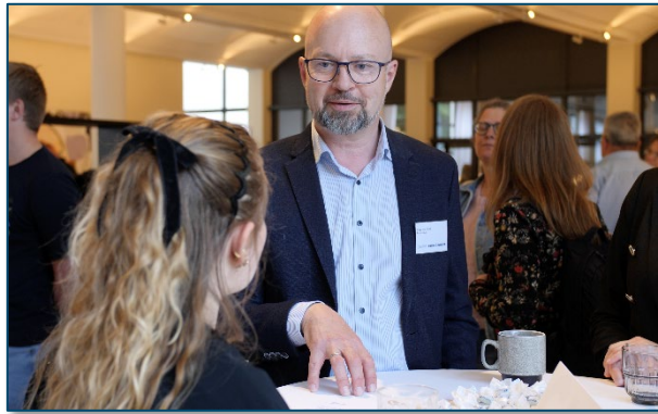
"Speeddating" med studerende ved DANVA's årsmøde

Vores tekniske designerelev fangede interessen for Provas, da vi i forbindelse med DANVA's årsmøde deltog i "speeddating" med unge nysgerrige studerende fra Aarhus Universitet, VIA University College, Syddansk Universitet og HANSENBERG.