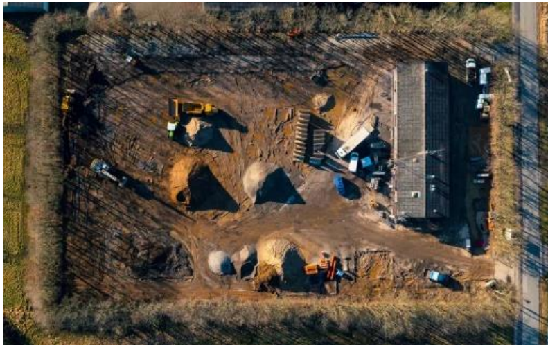
Figur 8 - Dronefoto fra Gram Genbrugsplads

Renoveringen af Gram Genbrugsplads er godt i gang. En fuld åbning af genbrugspladsen udskydes til sidst i juni, med indvielse efter sommerferien. Med den nuværende plan for myndighedsbehandlingen forventes det, at der kan opnås tilladelse til at åbne for modtagelse af haveaffald til pinse.