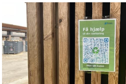
Figur 9 - Hjælp til selvhjælp i den ubemandede tid på genbrugspladsen QR-koder til sorteringsvejledningen

Som forsøg er der på genbrugspladserne hængt midlertidige skilte op med QR-koder til vores digitale sorteringsvejledning. Hensigten er at gøre det nemmere for de besøgende at finde hjælp til sortering i den ubemandede åbningstid. Der vil efterfølgende blive evalueret på effekten heraf.