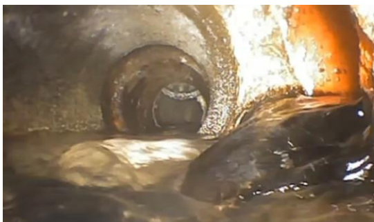
Figur 2 - Uønsket vand i kloakken

Bevtoft har oplevet spildevand på terræn ved engområdet. Det uønskede vand kommer fra utætte kloakledninger på privat grund, ved fejl- eller ulovlige tilslutninger fra omfangsdræn. Vi har optimeret på pumperne og lavet et godkendt nødoverløb. Vi har indkredset problemet ved TV-inspektion af ledningsnettet og Haderslev Kommune er ved at følge op med påbud. De lokale medier har været optaget af hændelsen.