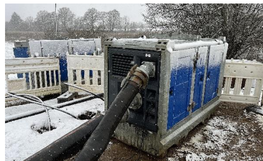
Figur 3 - Pumpe til midlertidigt nødoverløb.