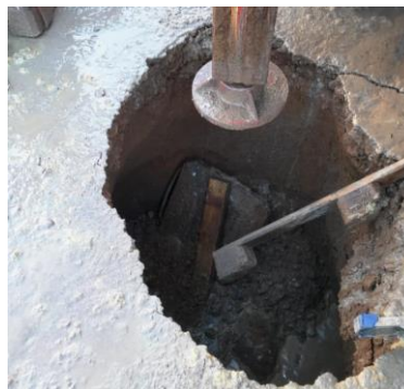
Figur 1 - 2 meter dybt jordfaldshul ved det nye kildefelt ved Vojens

Under etablering af det nye kildefelt i Vojens, har vi været udfordret af at ramme nogle hulrum i jorden. Jordfaldshuller opstår ved underjordiske sammenstyrtninger, i områder hvor jorden er blevet nedbrudt. Det betød at jorden flere gange faldt sammen om boringen efter 73 meters dybde. Første gang sank jorden til 2 meter under terræn og fyldte 52 meter af boringen op. For nuværende er der etableret 2 boringer.