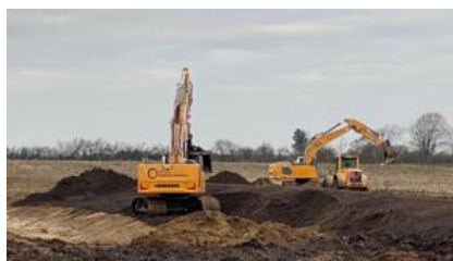
Figur 7 - Udgravning af regnvandsbassin i Gram

Nyt regnvandsbassin til håndtering af regn- og overfladevand på oplandet til Industrivej i Gram er udgravet og vil foruden rensning afhjælpe oversvømmelser i området.