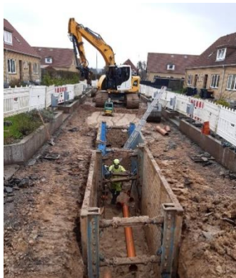
Figur 6 - Separatkloakering Møllevænget

Separatkloakering af Zeisesvej og Møllevænget, Haderslev pågår, da det eksisterende ledningsnet var udtjent her. Samtidig udskiftes vandledningen på Møllevænget. I Hoptrup er sidste del af anlægsarbejderne med udskiftning af spildevandsledningerne også i gang.