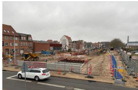
Figur 5 - 'Vandets kaskade' tager form