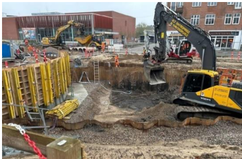
Figur 4 - Bassiner tager form

Anlægsprojektet er godt i gang i den vestligste etape og de første bassiner samt 'Vandets kaskade' begynder at tage form. Da der skal anlægges regnbede og plantes nye træer, kunne den eksisterende fællesledning ikke beholde den nuværende placering i vejarealet. Den er derfor ved at blive lagt om, hvilket spærrer dele af Jomfrustien for gennemkørsel.